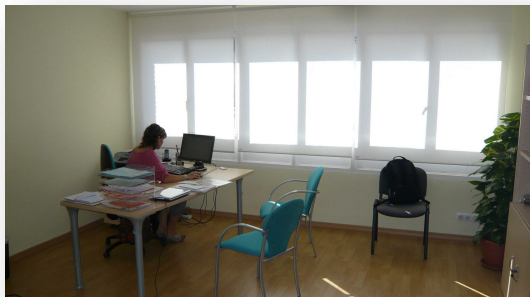
Secretaría en la sede del COLCV en la calle Gascó Oliag de Valencia. 11 de junio de 2010

personas y una sala donde se pueden impartir cursos de formación de hasta treinta personas. Esperamos que los nuevos locales permitan incrementar notablemente la participación en la gestión del colegio, a través de las Comisiones, y también la "vida colegial", a través de los grupos de trabajo y del programa de formación.