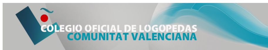
Boceto inicial para la cabecera de la próxima página web del COLCV

Esperamos que esta iniciativa sea de vuestro agrado.