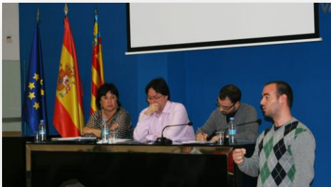
Asamblea General Ordinaria del COLCV. día 09-04- en la sede del Colegio de Enfermería de Valencia, Av. Blasco Ibáñez, 64 Entlo; 46021, Valencia.

El COLCV celebró su Asamblea General Ordinaria el día 9 de abril de 2011 en la sede del Colegio de Enfermería de Valencia. Asistieron 21 colegiados. En votación ordinaria se aprobaron los resultados de la gestión económica de 2010 y los presupuestos para 2011.