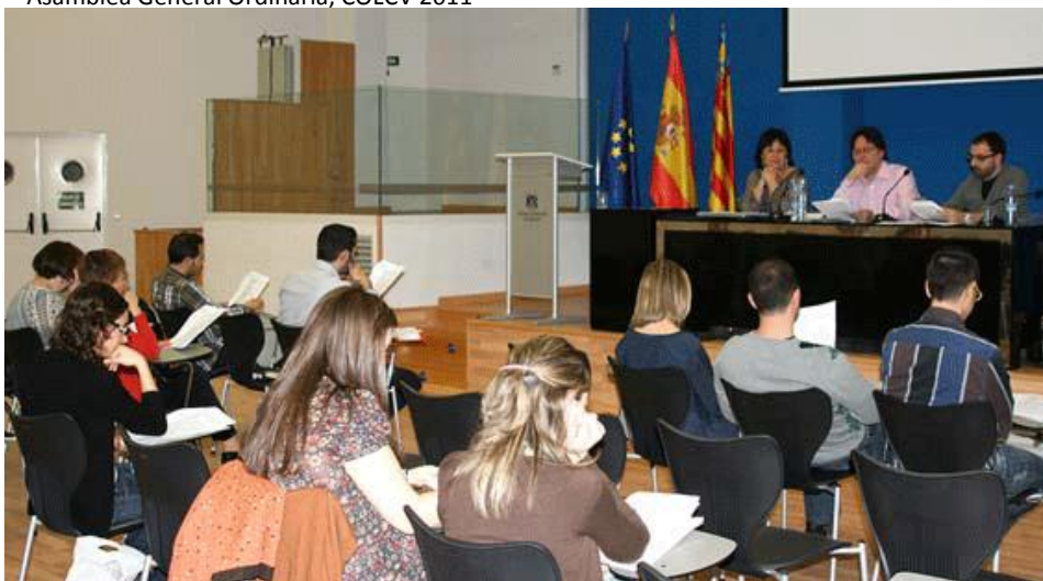
Asamblea General Ordinaria, COLCV 2011

Correspondiente primer trimestre del año 2011.