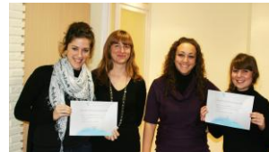
Participantes en el acto sobre “Emprendedores” y nuevas colegiadas mostrando su certificado de colegiación