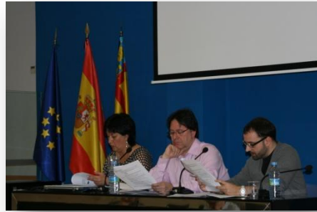
Lectura del acta de la anterior Asamblea General.